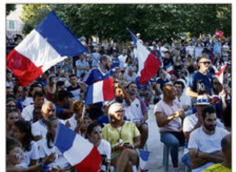
Contrairement à l'est-Var, dans l'aire toulonnaise, pour la demi-finale, Carqueiranne avait été la seule commune à organiser une retransmission.